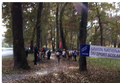
Belle allée de chênes pour un beau circuit et le parc à vélo sur ce tapis de feuilles, l'automne est bien là.