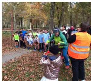
Le départ donné par une future JO

Au Bois de Boulogne à Dax, mercredi dernier, s'est déroulé le duathlon des collèges. Organisé avec l'aide de parents d'élèves sur un parcours de 635 m de course à pied, puis 4 km de VTT et pour finir par une boucle encore de 635 m en course à pied.