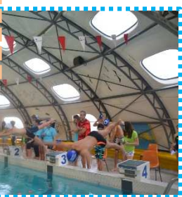
Avec sur le bord du bassin les Jeunes Juges en bleu chrono en main !