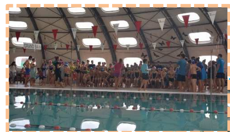
Les 150 nageurs à l'écoute des consignes et c'est parti...