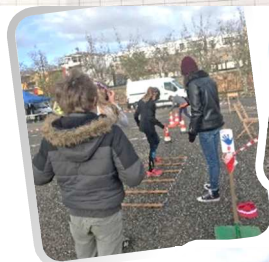
Elles avaient pour but de divertir et sensibiliser les jeunes licenciés sur la prévention routière. Simulation d'état d'ivresse, drogue et simulateur de tonneaux...