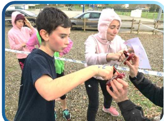
championnat départemental, le premier pour l'UNSS 40.

Avant de débiter 2019, un petit retour en arrière sur la vie d'AS pour le dernier mercredi de 2018.