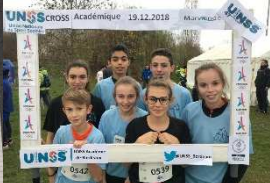
AS qualifiée pour le cross académique.

Pour la première fois, cette année, une compétition de Laser run a été mise en place. L'équipe du collège de Villeneuve-de-Marsan n'a pas hésité à participer.