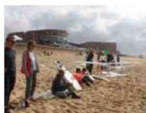
Enseignants, juges et partenaires.