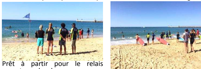
Prêt à partir pour le relais sauvetage planche...

Très attentifs aux ateliers de secourisme et de bouée tube, sous l'œil vigilant des secouristes du club de sauvetage d'Hossegor dont la demoiselle a participé au championnat du monde de sauvetage côtier !