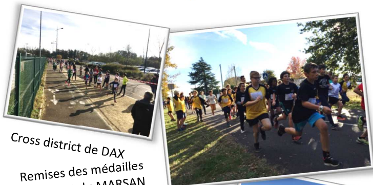
Cross district de DAX Remises des médailles au district du MARSAN

Rendez-vous est pris pour le cross départemental du 29 novembre au Parc de Nahuques à Mont de Marsan