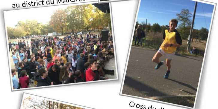
Cross du district CÔTE D'ARGENT