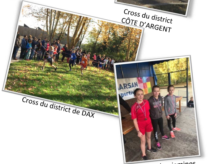
Cross du district de DAX